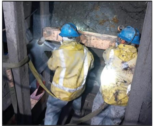
Mantenimiento de cuadros