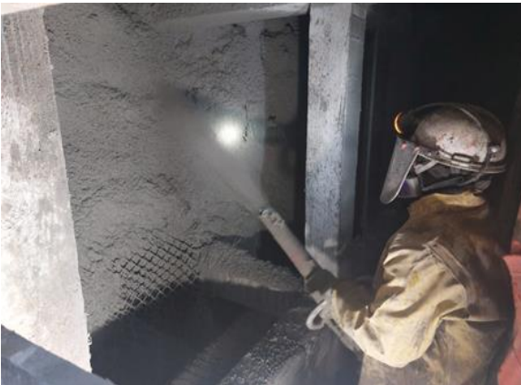
Reforzamiento con Shotcrete