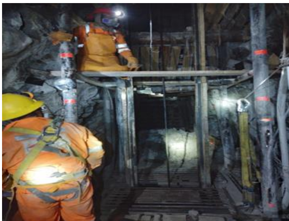
Reparación Estación 1