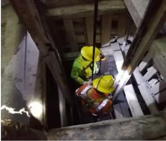
Cambio de Guías de Izaje