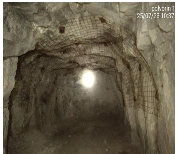
Cámaras para Polvorín