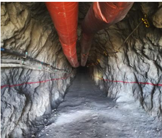
Crucero principal 300 W