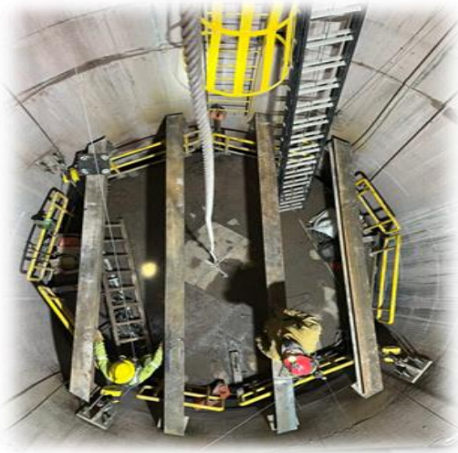
Construcción Pique Circular Carlos