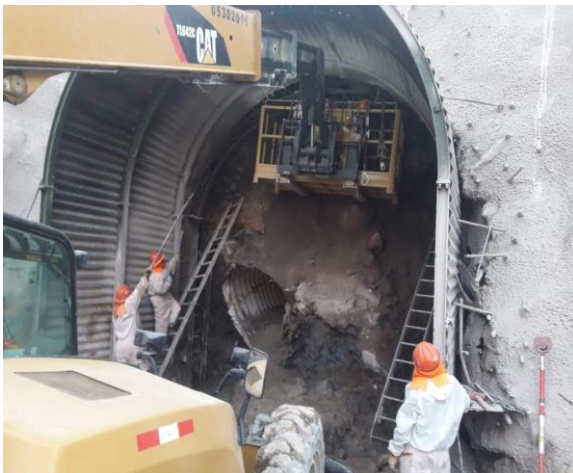
Instalacion de Cimbras