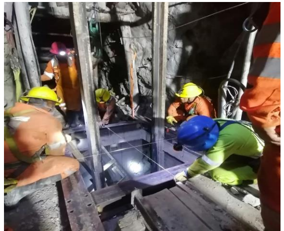
Alineacion de Cuadros de madera