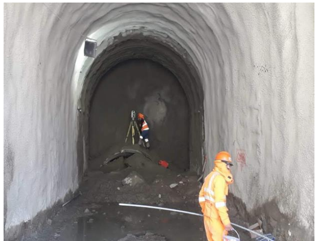
Revestimiento del Tunel con Shotcrete