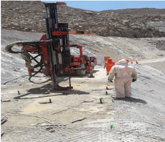
Pernos con Inyeccion de Concreto