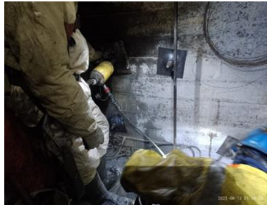
Instalación de Cable Bolting 9 m.