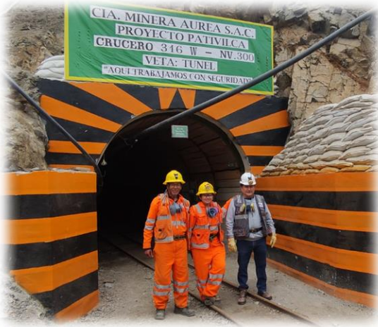
Portal de ingreso Nv. 300