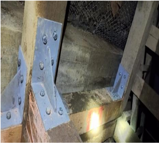
Reforzamiento con brackets