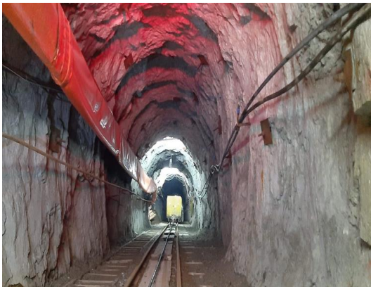
Inclinado 650 Nv. 18