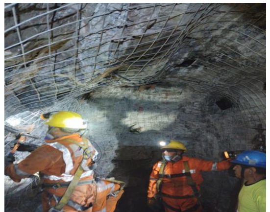
Reforzamiento del Sostenimiento