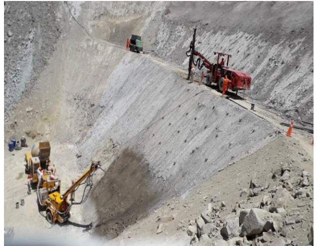
Estabilizacion de Taludes